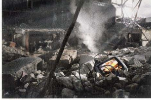
Clíent: Quote Concept: Thierry Somers

goudgeschminkt model. Eigenlijk hetzelfde idee als de leader van de James Bond-film Goldfinger. 'Daar hebben we goed naar gekeken. We hebben eerst geëxperimenteerd met hoe we de puitsant dure auto's en jachten het beste konden projecteren. In nabewerking werd het een platte sandwich, dus we hebben uiteindelijk een projector gebruikt waar je mee kunt flitsen. Daarmee hebben we dia's geprojecteerd op het model. Het mooie van een projectie is dat het heel vloeidend om zo'n lichaam heen vouwt en zich mengt met de overige verlichting. Het wordt bijna een soort visagie. Je loopt bij dit soort producties natuurlijk het risico dat het kitsch wordt en Quote zoekt nu eenmaal graag het randje op. Maar ik vind het toch mooi stijlvol geworden.'