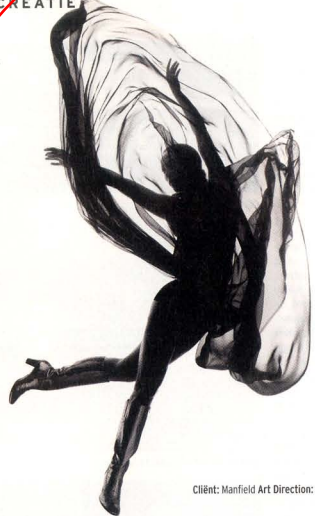
Clíent: Manfield Art Direction: Jeff de Wolf