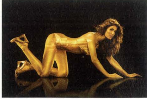
Clíent: Quote Concept: Thierry Somers